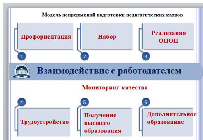
Рис 3. Модель непрерывной подготовки педагогических кадров

Колледж ведет системную работу по обеспечению педагогическими кадрами городских и сельских образовательных учреждений. Совместно с работодателями создана и эффективно функционирует модель непрерывной подготовки педагогических кадров по 6 направлениям (рис.3)