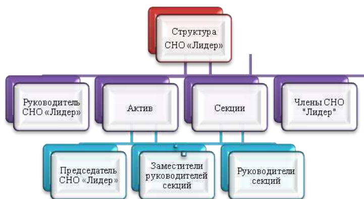
Рис 2. Структура СНО «Лидер»

Студенты колледжа являются активными участниками СНО «Лидер».