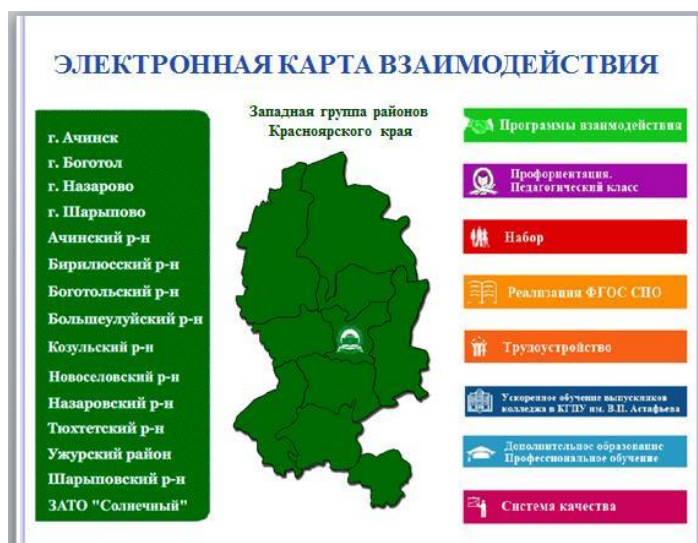
Рис 4. Электронная автоматизированная карта взаимодействия

Мобильность и результативность реализации модели обеспечивает электронная автоматизированная карта взаимодействия (рис 4.).