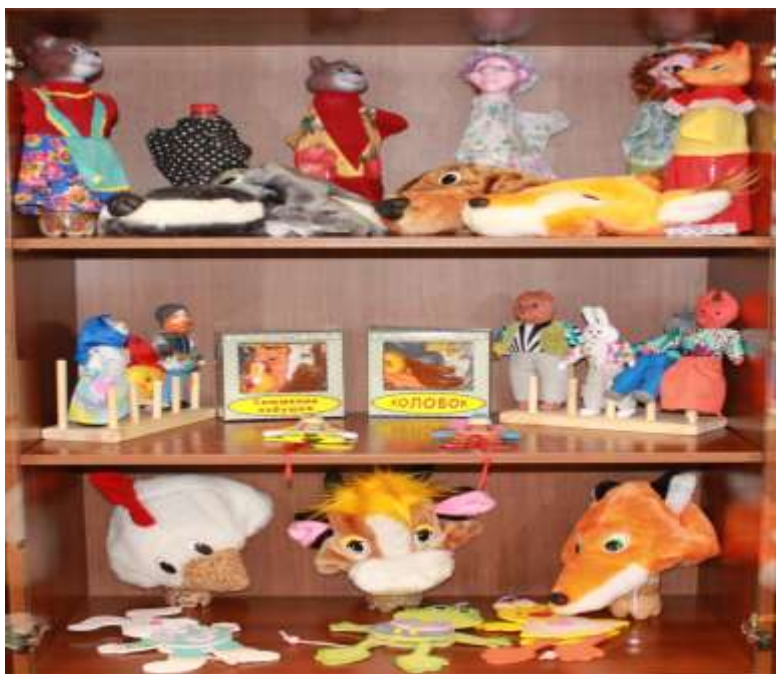
Оборудование для театральной деятельности