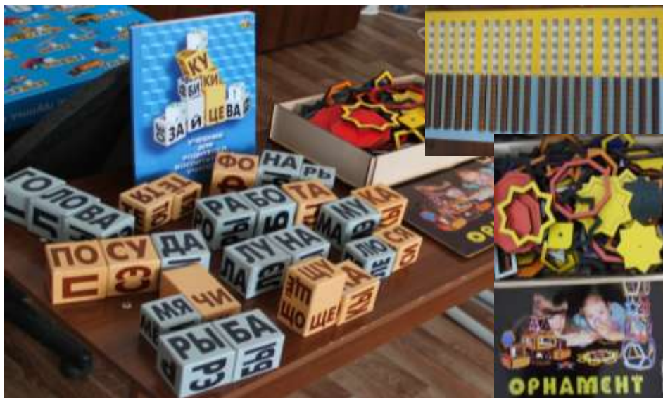
Учебно-методические пособия Н.А.Зайцева