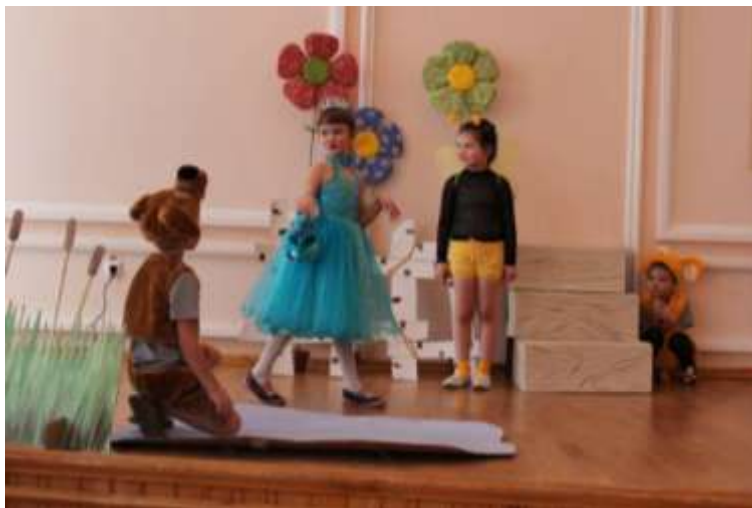
Премьера сказки «Кто сказал мяу?» в театральной студии «Буратино»