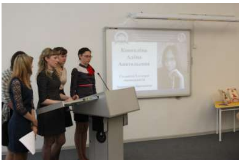
Презентация «Визитная карточка» студентов-участников проекта «Наш новый детский сад»