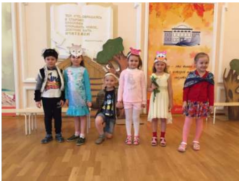
Драматизация сказки «Зимовье зверей»