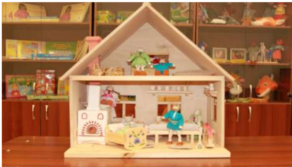
Игровой набор «Жили-были»