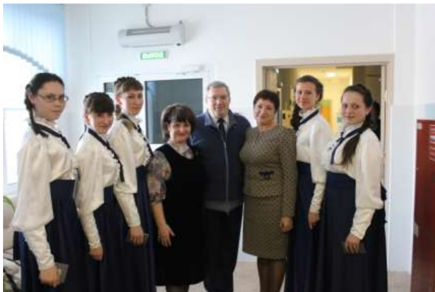
Открытие детского сада «Журавленок» в городе Ужуре