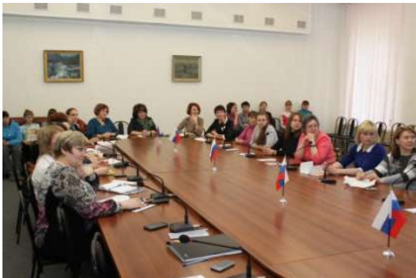
Защита проекта основной общеобразовательной программы детского сада «Журавленок»