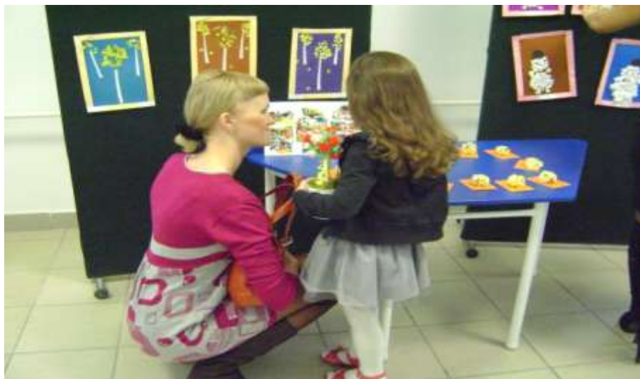
Выставка детских работ в студии декоративно-прикладного искусства «МалаХИТовая шкатулка»