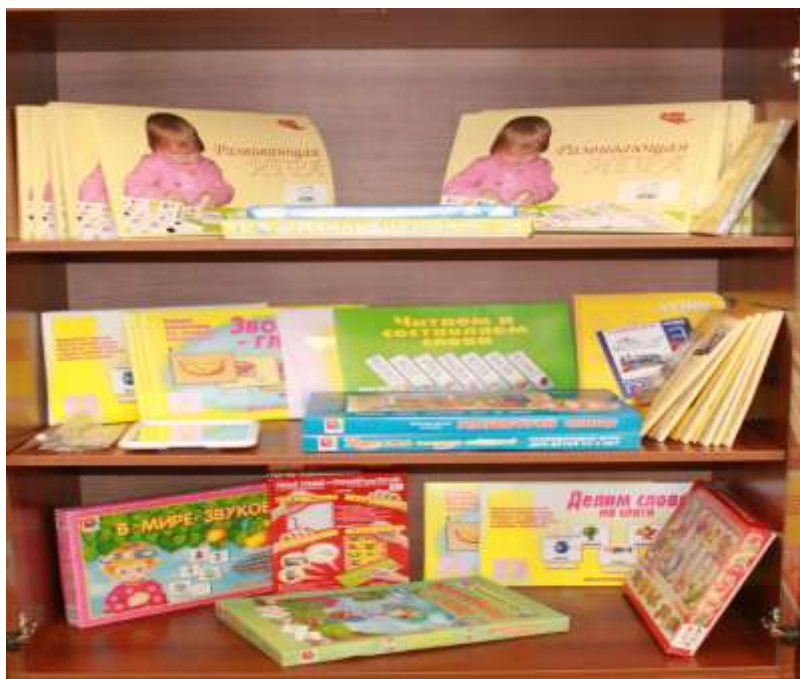
Дидактические пособия по речевому развитию