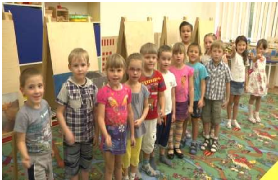
Открытое мероприятие для родителей по модулю «Зазеркалье»