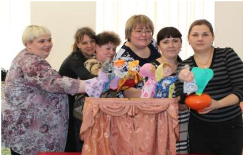
Практические занятия слушателей курсов повышения квалификации по программе дополнительного профессионального образования «Современные образовательные практики» (воспитатели города Ачинска и Ачинского района)