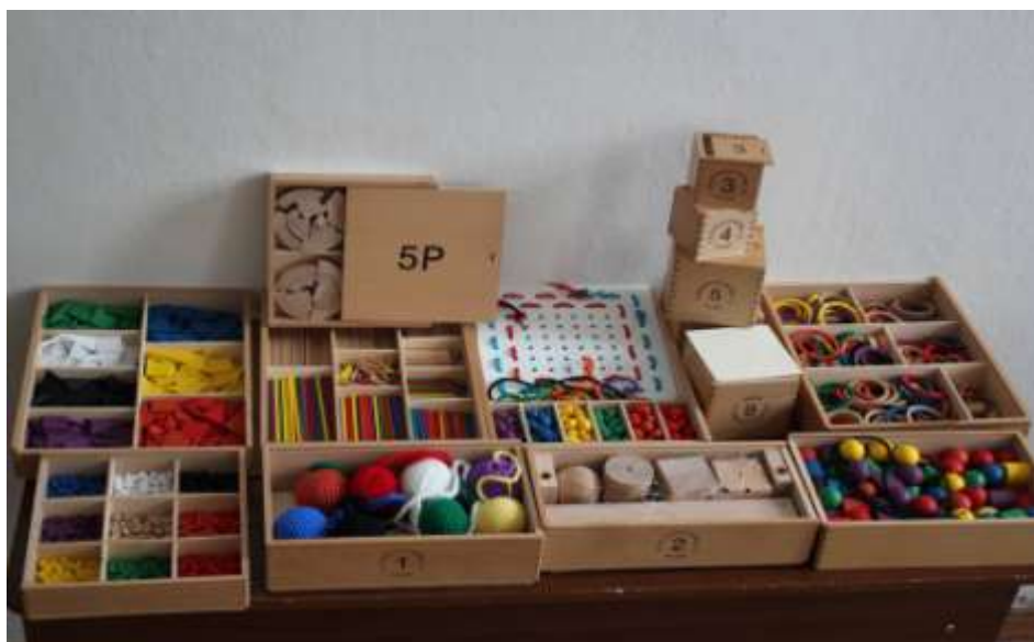
Игровой набор «Дары Фрёбеля»