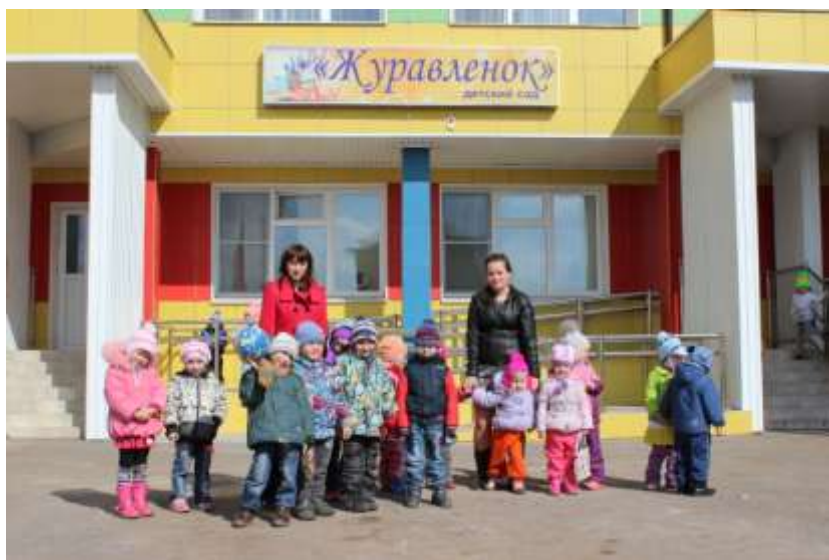
Участники проекта на своем рабочем месте – в Детском саду «Журавленок» г. Ужура