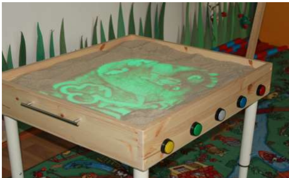
Стол-платиет для рисования песком