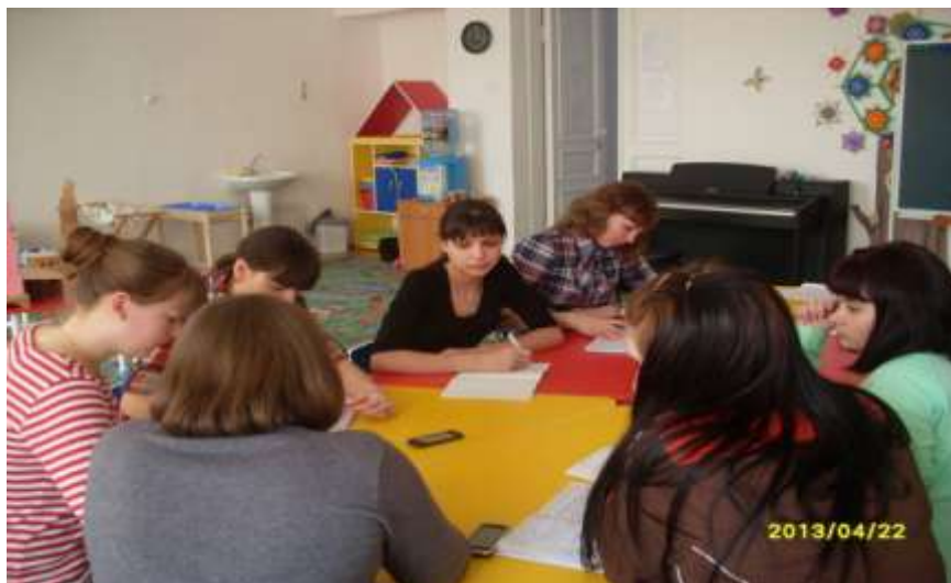
Практическое занятие студентов 2 курса по теме «Организация предметно-развивающего пространства в разных возрастных группах детского сада»