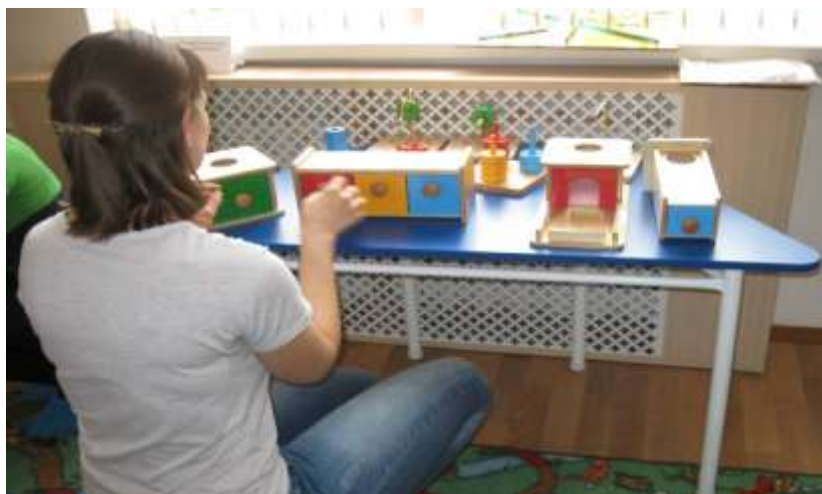
Практическое занятие студентов 1 курса по теме «Возможности оборудования М. Монте梭ри в коррекционной работе с детьми дошкольного возраста»