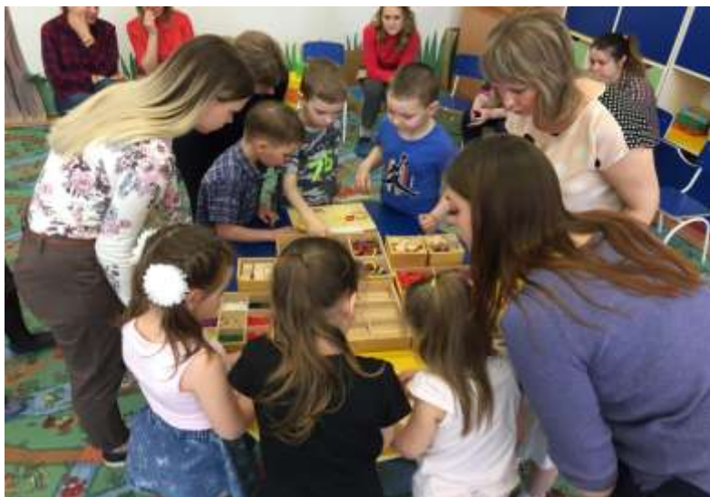
Организация игровой деятельности студентами 2 курса «Играем вместе»