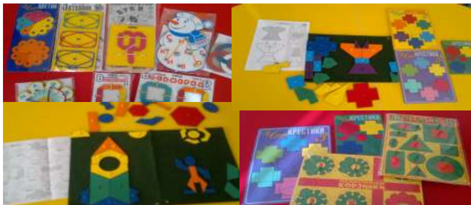
Комплекс игр технологии интеллектуально-творческого развития детей 3-7 лет В.В. Воскобовича