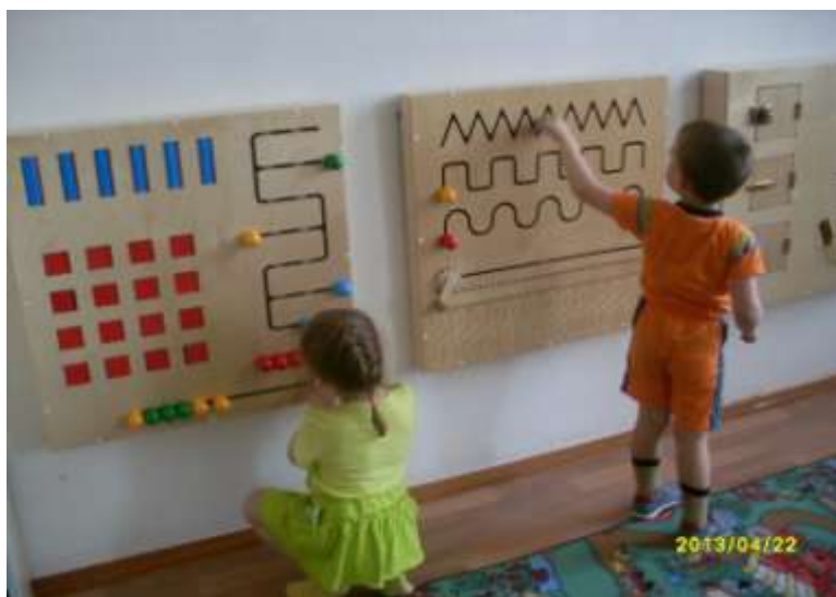
Развивающие занятия с детьми младшего дошкольного возраста по методике Марии Монте梭ори