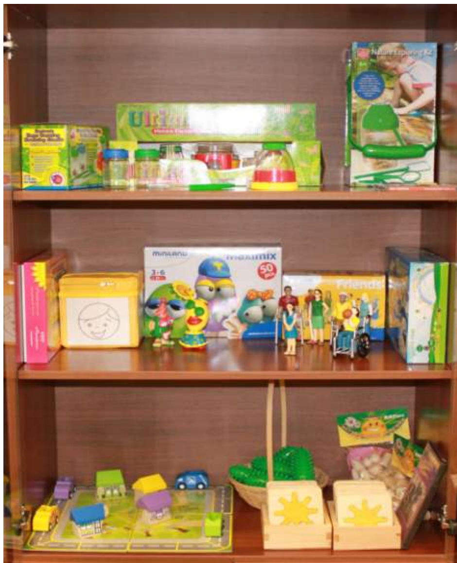
Наглядный материал и оборудование для познавательного развития детей