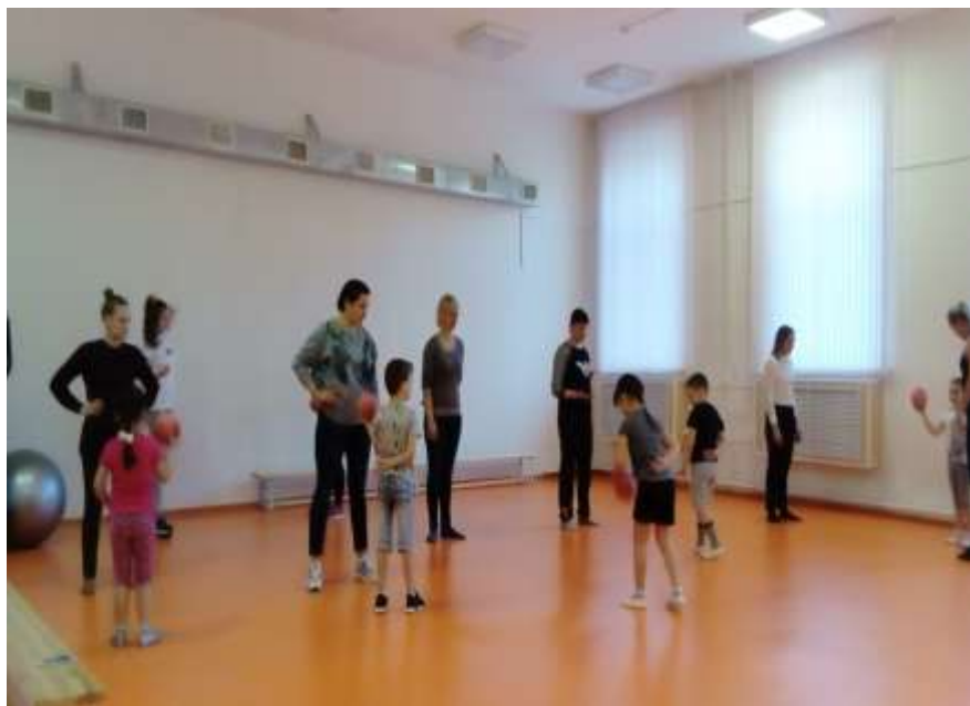
Итоговое мероприятие по модулю «Детский фитнес»