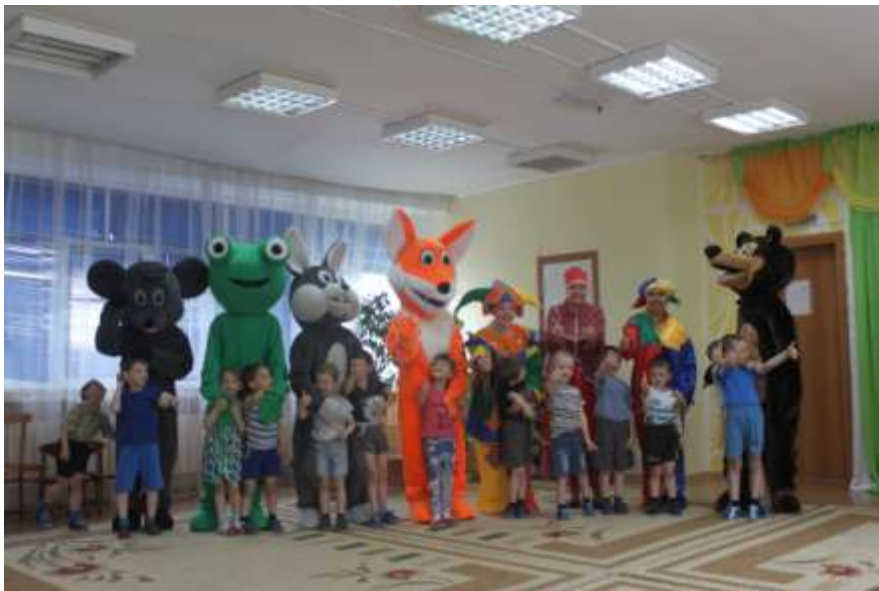
Проект «Наши добрые сказки» с участием воспитанников детского дома