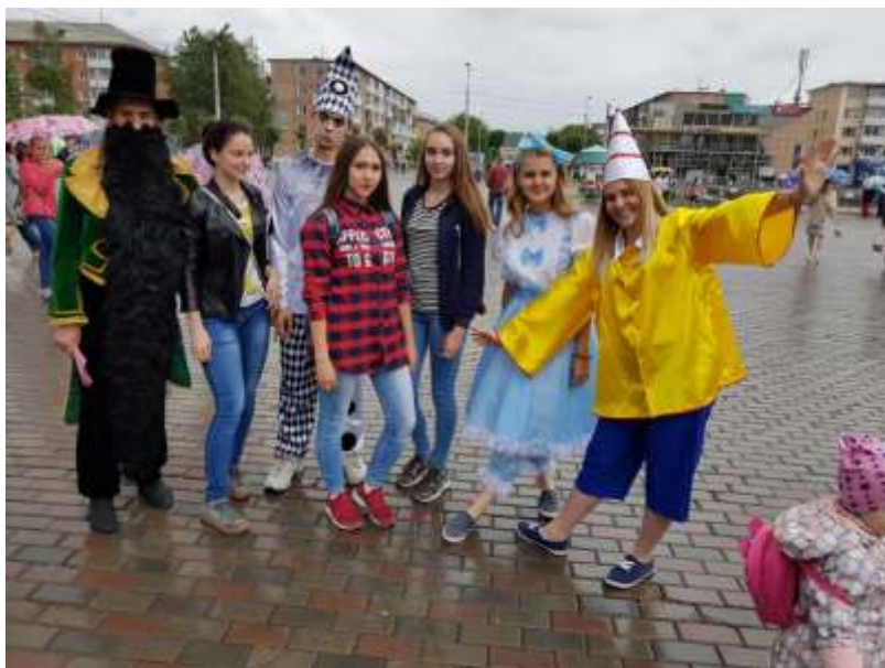
Акция, посвященная Дню города