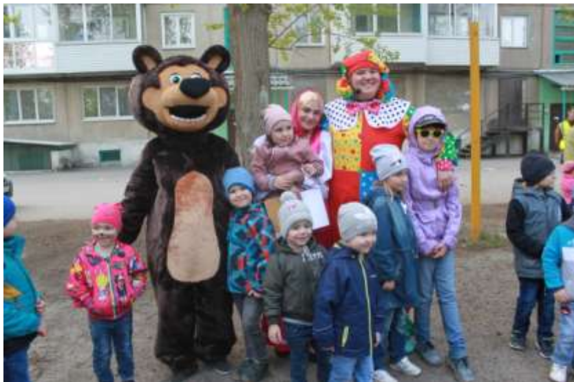
Праздник микрорайона, посвященный юбилею города Ачинска и 90-летию Ачинского педагогического колледжа