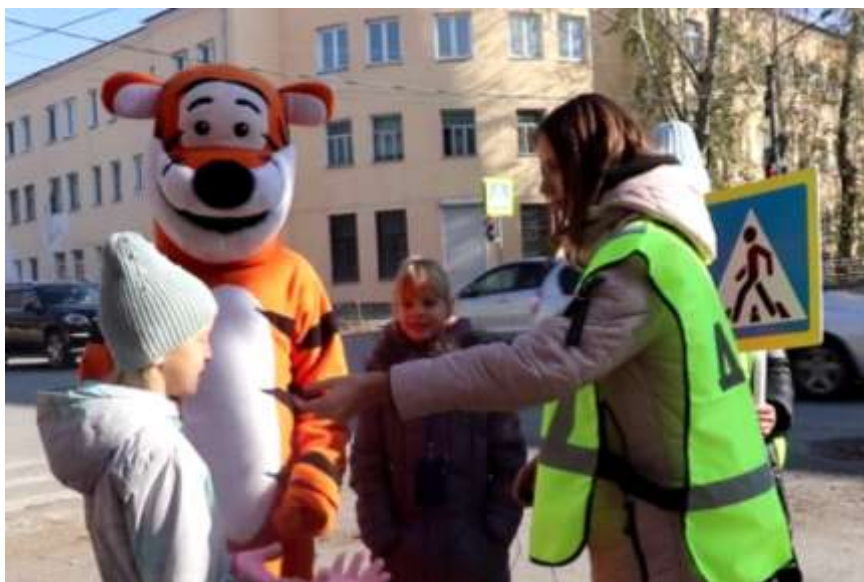
Акция по безопасности дорожного движения «Будь заметней на дороге»