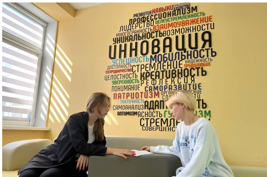
Зона коворкинга «ИдеяЛаб»