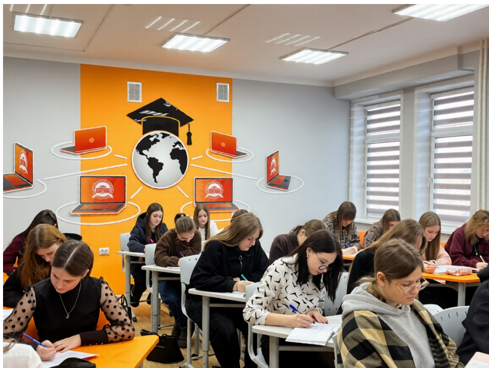
Студенты погружены в учебный процесс Кабинет 2-04