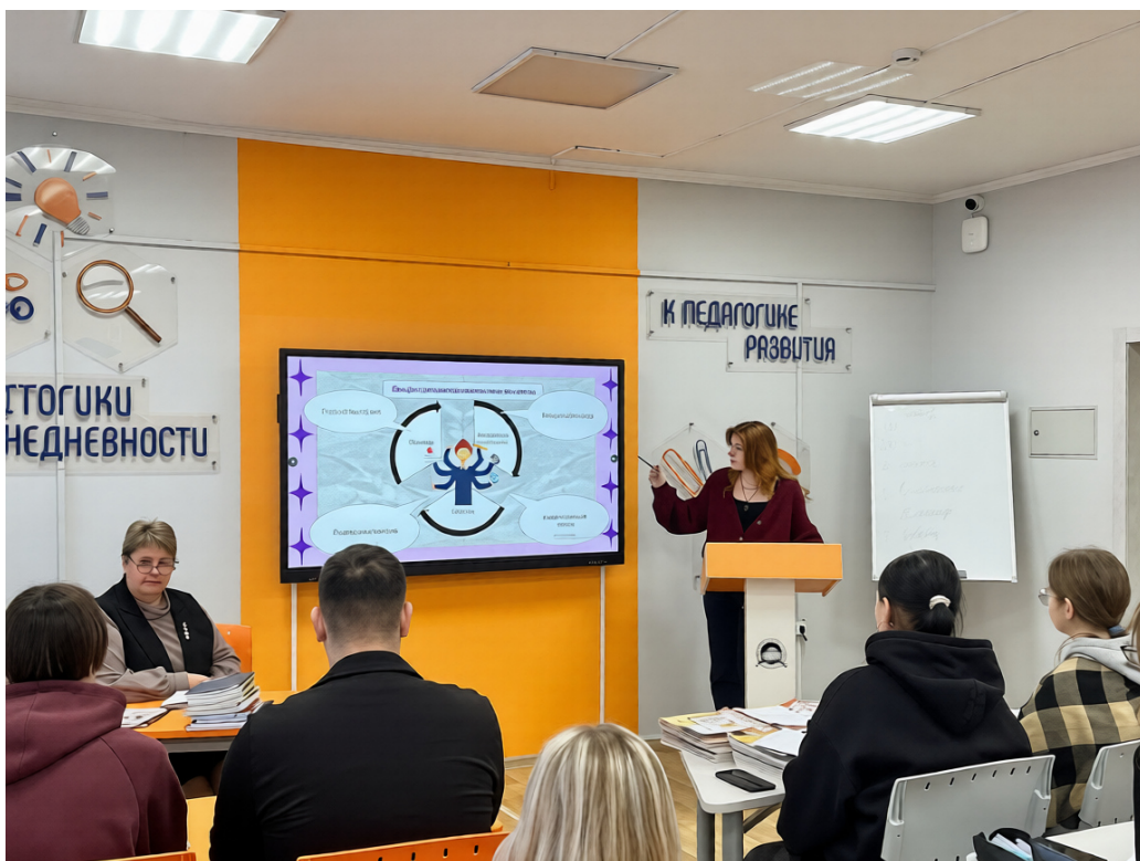
Защита студенческого проекта Кабинете 2-04

Зона коворкинга «Учимся Вместе» расположена в кабинетах 2-04, 2-05, 2-06, представляет образовательного пространства, позволяющего студентам и преподавателям эффективно учиться, сотрудничать и получать новые знания. В этом пространстве возможно проведение мастер-классов, тренингов, проектной работы, научно-исследовательской деятельности, подготовки презентаций и выступлений. Современное оборудование обеспечивает свободный доступ к цифровым ресурсам, поддерживает гибкость рабочего процесса и формирует навыки самостоятельной работы и коммуникации.