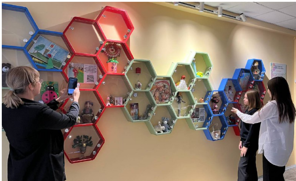
Интерактивная стена: Мир современного ребенка