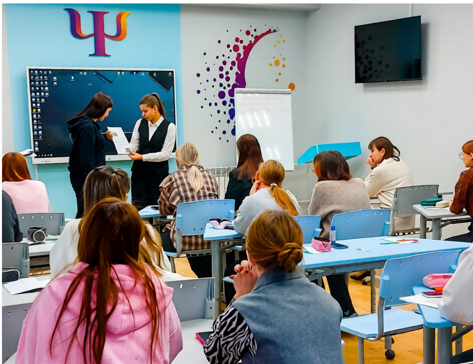
Представление результата выполнения практической работы Кабинет 2-06