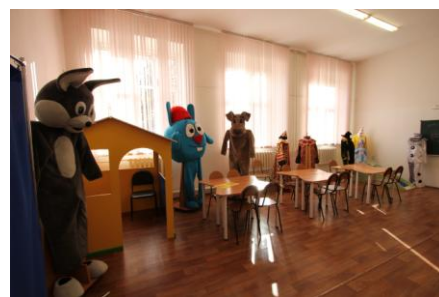
Кабинет-лаборатория дополнительного образования