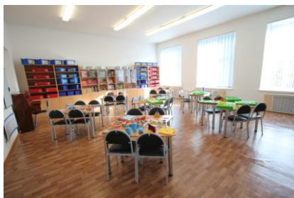
Кабинет-лаборатория начального общего образования