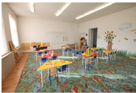
Кабинет-лаборатория дошкольного образования