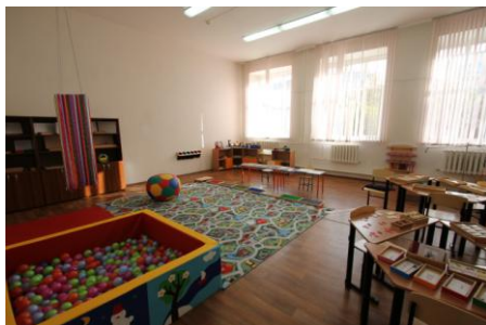
Кабинет-лаборатория инклюзивного образования