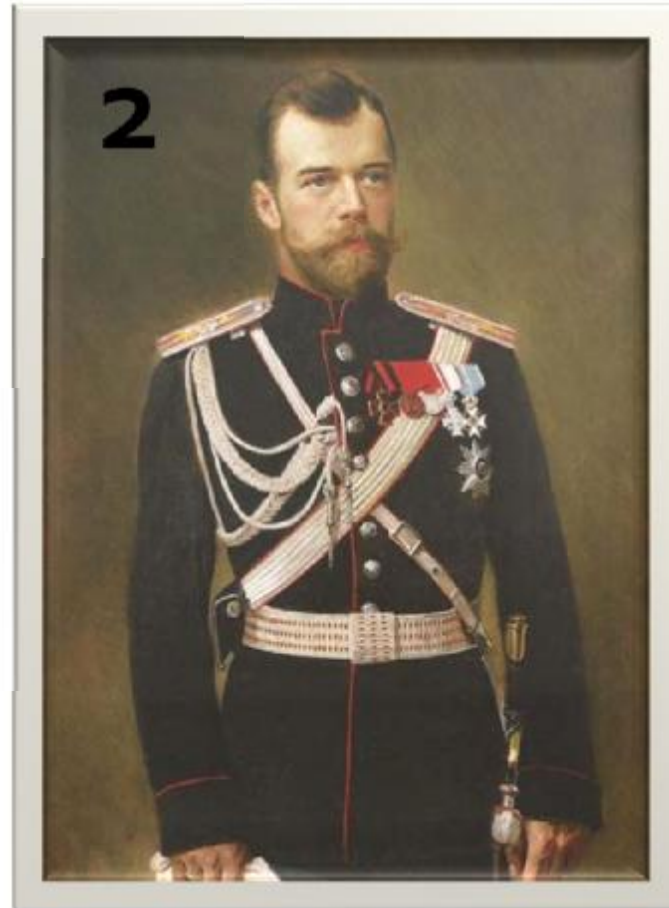
Николай II – последний российский император династии Романовых.