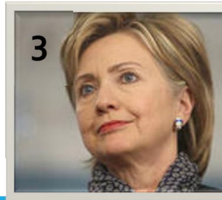
Хиллари Клинтон – американский политический деятель, государственный секретарь США (с 2009)