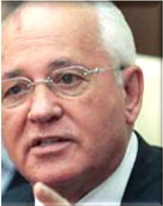
Михаил Сергеевич Горбачёв Генеральный секретарь ЦК КПСС 1985-1991